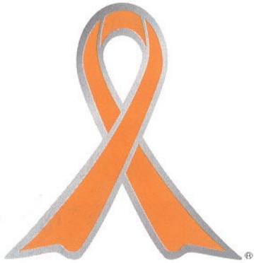
オレンジリボンには子供虐待を防止するというメッセージが込められています。

虐待を受けたと思われる子供を見つけたときやご自身 が出産や子育てに悩んだときには、児童相談所や市町 村の窓口ご連絡してください。